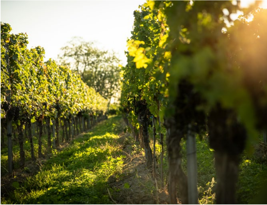
Im Weinberg am Kaiserstuhl

»Die Qualität und die Oberfläche von den Tanks ist so glatt und so super, dass kein Weinstein dran haftet, du bekommst die Tanks pico sauber.«